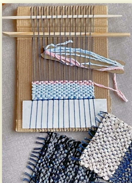
ダンボール織機でたのしむ織物