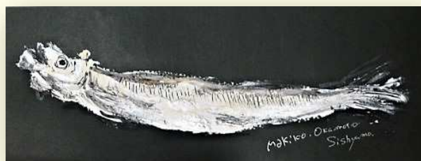
ストレス緩和&認知症予防の新絵画講座