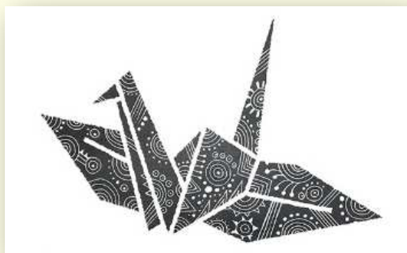
ボールペン模様アート