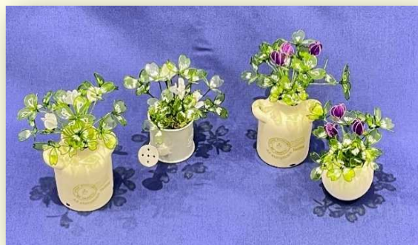
アメリカンフラワー(クローバーをつくらう)