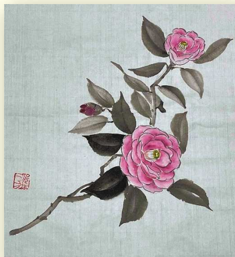
はじめての彩墨画