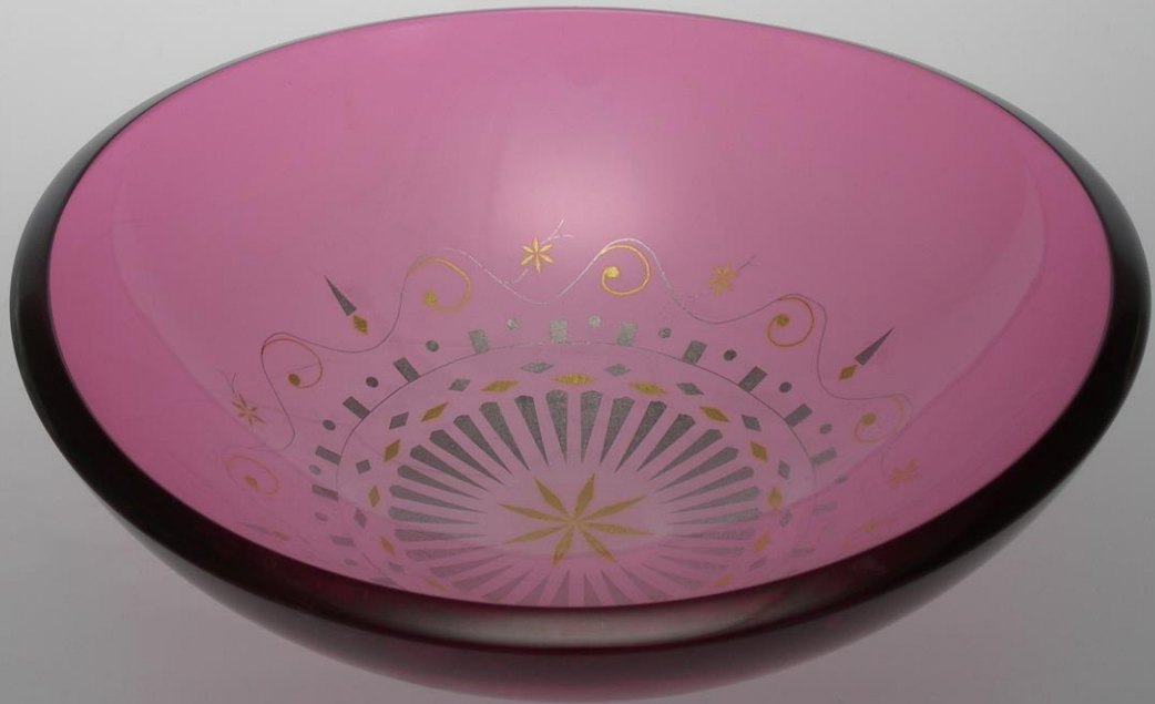
ゴールド・サンドイッチ・ガラス碗「宙」(そら) 個人蔵

紀元前2世紀ごろ地中海沿岸で作られていた「ゴールド・サンドイッチ・ガラス」の研究、復元・再現制作、その応用作品を中心に、奈良唐招提寺「国宝・舍利容器白瑠璃舍利壺」、正倉院宝物「緑瑠璃十二曲長坏」、重要文化財「一乗谷朝倉氏遺跡出土リブ付きガラス容器」の調査・復元の様子など動画や普段見られない画像などを交えながらお話しします。