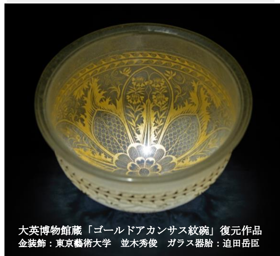
大英博物館蔵「ゴールドアカンサス紋碗」復元作品 金装飾：東京藝術大学 並木秀俊 ガラス器胎：迫田岳臣