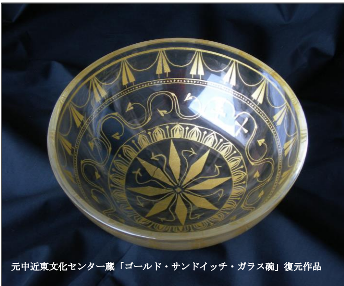
元中近東文化センター蔵「ゴールド・サンドイッチ・ガラス碗」復元作品

岡山市立オリエント美術館 古代オリエント博物館 唐招提寺 奈良国立博物館 東京理科大学 加計美術館